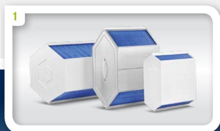
Belüftungskomponenten für Wohngebäude